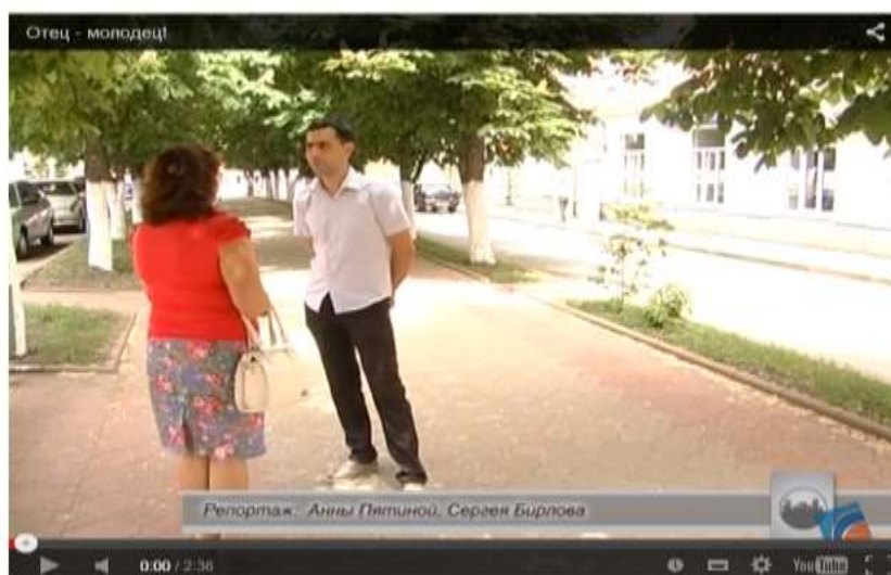
На последнем заседании «Женсовета» было принято решение о создании в нашем городе «Совета отцов». Откладывать идею в долгий ящик не стали, и уже в середине июня новая общественная организация приступит к работе.