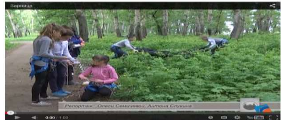
В Ливнах стартовал городской этап военно-спортивной игры. Первый тур соревнований состоялся сегодня в Комсомольском парке.